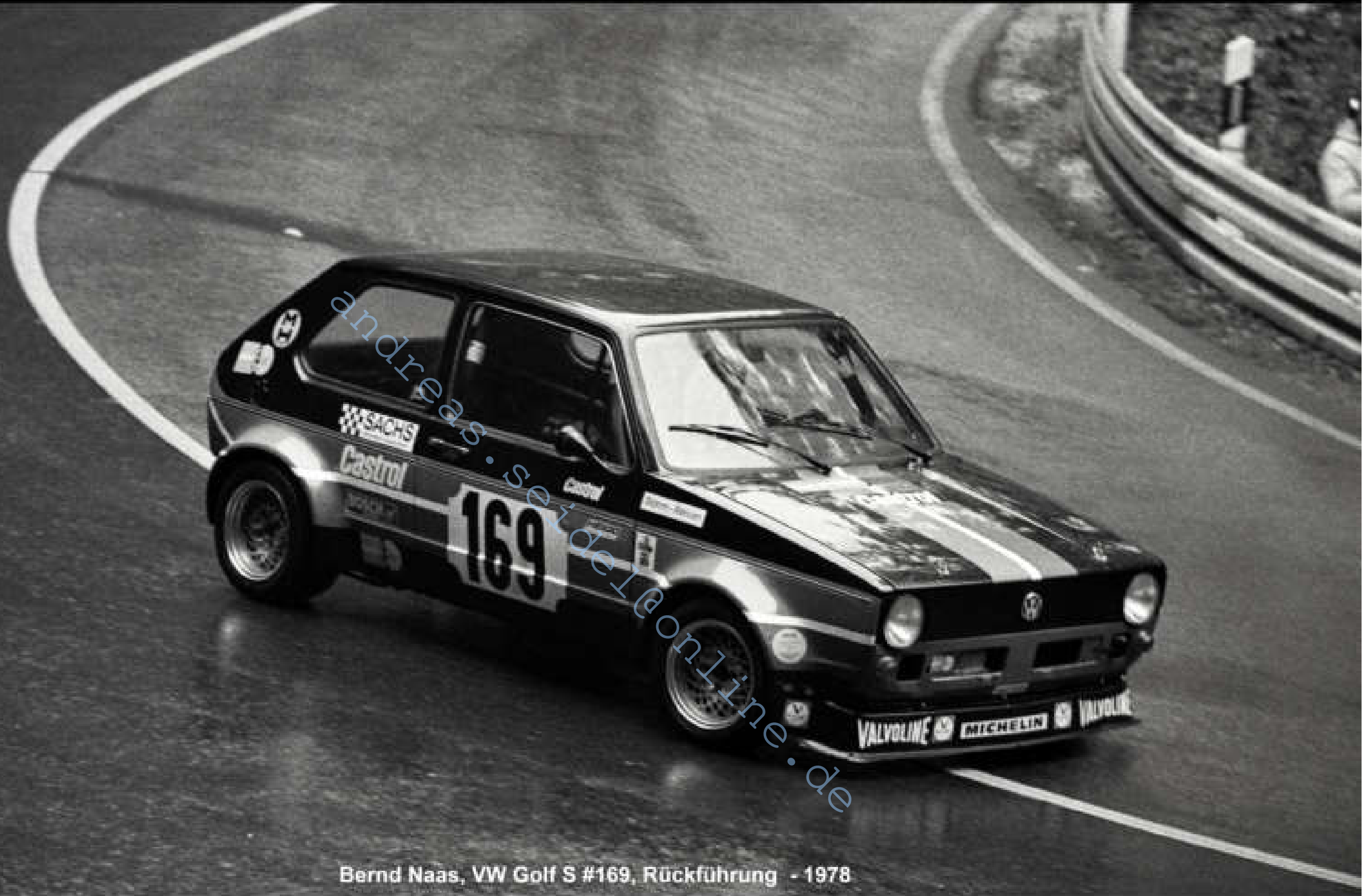
Bernd Naas, VW Golf S #169, Rückführung - 1978