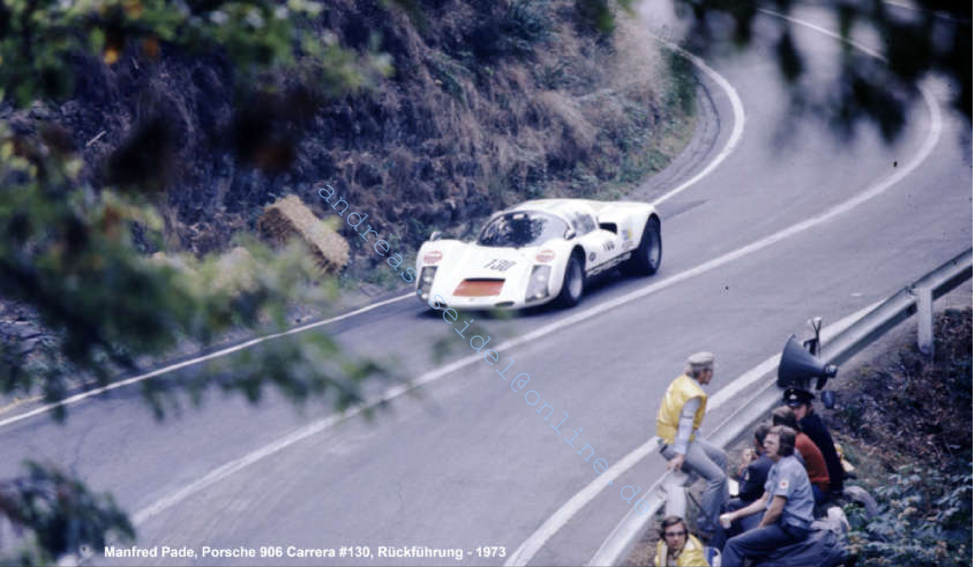
Manfred Pade, Porsche 906 Carrera #130, Rückführung - 1973