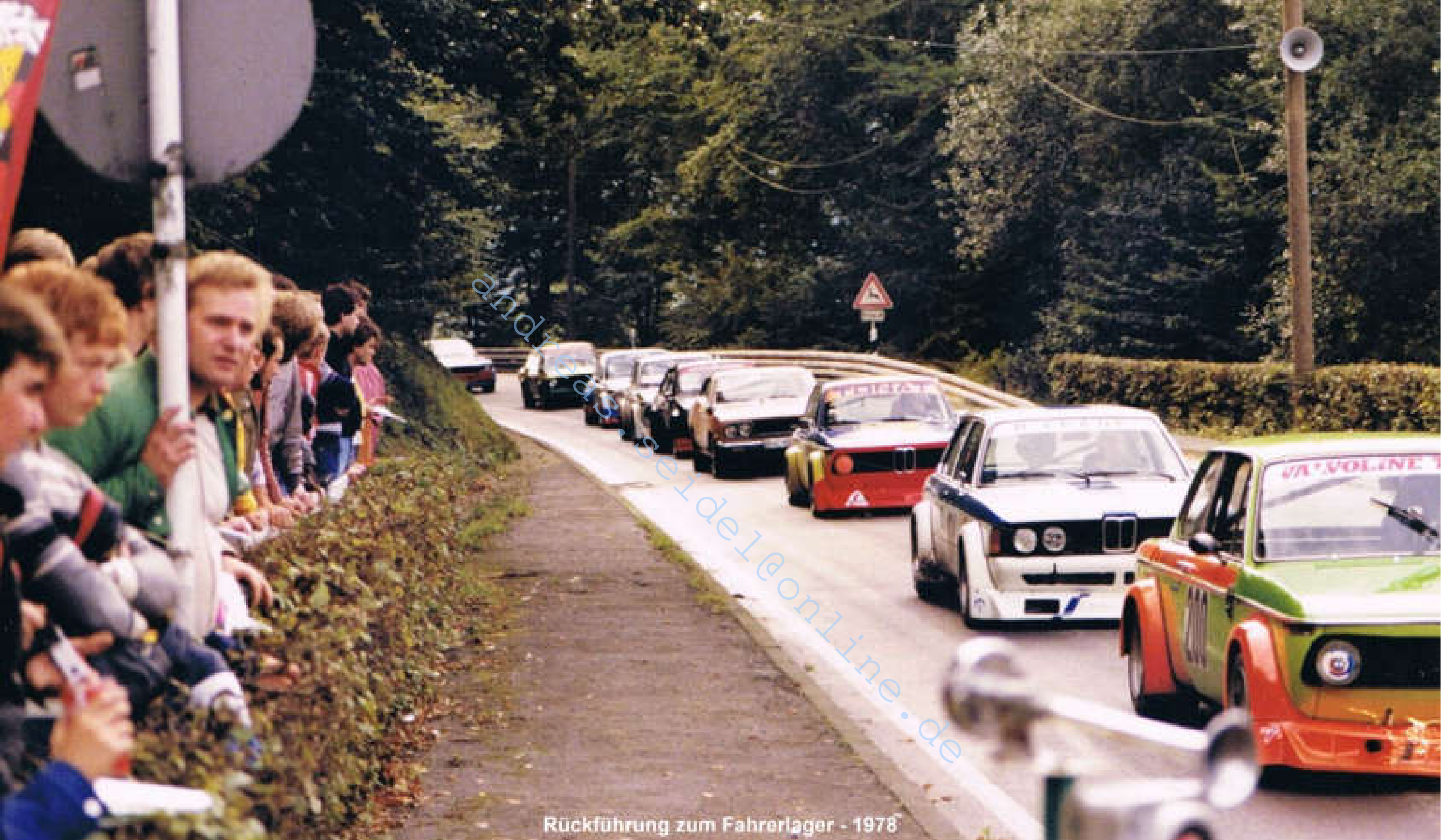
Rückführung zum Fahrerlager - 1978